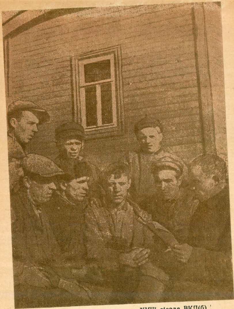
На снимке: Читка материалов XVIII съезда ВКП(б) в полевом лагере.

Колхоз обзавелся большим количеством подсобных предприятий. Он имеет хороший фруктовый сад, площадь в 70 гектаров, огород в 20 гектаров, пчельник из 320 ульев, пекарню с производительностью 600 кило-