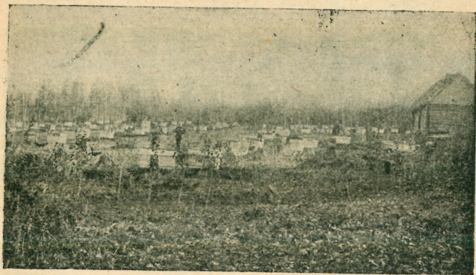
П а с е к а.

На прошедшей районной с.-х. выставке коммуна подвела итоги своих достижений. В результате она получила 6 похвальных свидетельств: по полеводству—за высокую урожайность, свидетельство 1-й степени, за хорошо выращенный плодово-посадочный материал—1-й степени, за племенное качество рогатого скота—1-й степени, по свиноводству, за его племенное качество—1-й степени, за племенные качества жеребца «Сарта»—2-й сте-