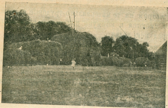
Укладка сена в скирды когтями.

Это еще ярче можно показать на характере с.-х. инвентаря коммуны. Обилие разнообразнейшего инвентаря (в коммуне есть отдельные с.-х. машины, весьма редкие для СССР, например: картофелевыкапыватель, сеноподаватель, навозоразбрасыватель), наличие 5 тракторов и локомобиля с достаточным прицепным с.-х. инвентарем выгодно выделяет коммуну в ряде селений и даже колхозов района.