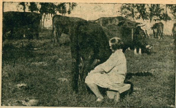
Дойка коров на базе.