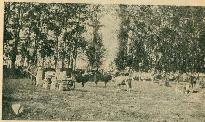
Дойка коров на базе.

Молочное хозяйство сейчас уже переходит из стадии по требительской в стадию товарную.