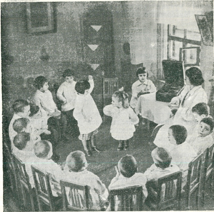
Воспитанники детского сада любят танцевать.