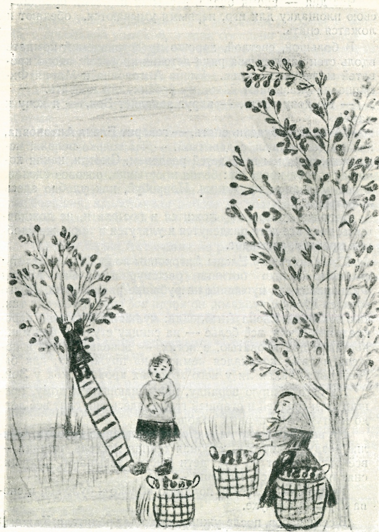
«Наши мамы собирают в колхозном саду яблоки».

Выходят на прогулку и дети средней группы, затем — старшей. Для каждой группы — своя площадка, отделё-