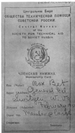
Членская книжка Общества технической помощи Советской России.

«Хочу сам увидеть...» В поездку с писателем увязались и Асторы.