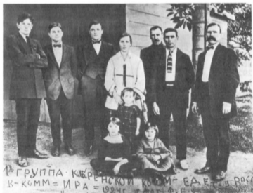
Из далекой Австралии возвращаются на родную землю эти люди, чтобы внести свой вклад в создание новой, социалистической России.