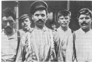
Металлурги из Питтсбурга — русские иммигранты.

вала новенькая металлическая пластинка с надписью: «Бюро русского советского представительства».