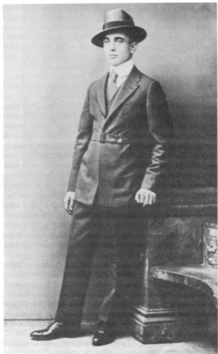
Петр Скорупский — один из организаторов возвращения в Советскую Россию среди российских иммигрантов. Снимок сделан в 1916 г. в Нью-Йорке.